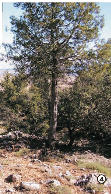
Encinas y Sabinas