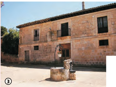
Casa del Cura Merino

4 No parece extraño que los montes que rodean la localidad fuesen refugio de guerrilleros. Un bosque cerrado de encina y sabina se extiende por las laderas del Alto del Risco, punto más alto del itinerario. De hecho el nombre de Fontioso debe su origen a que sus tierras albergaban 'fuentes y osos'.